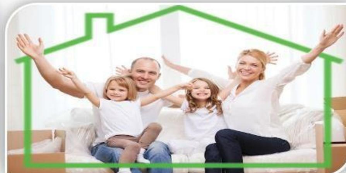
परिवार की सुरक्षा