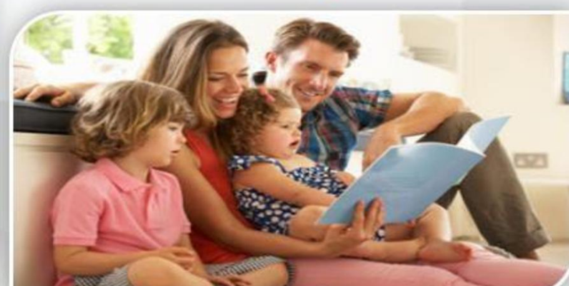
परिवार के साथ समय