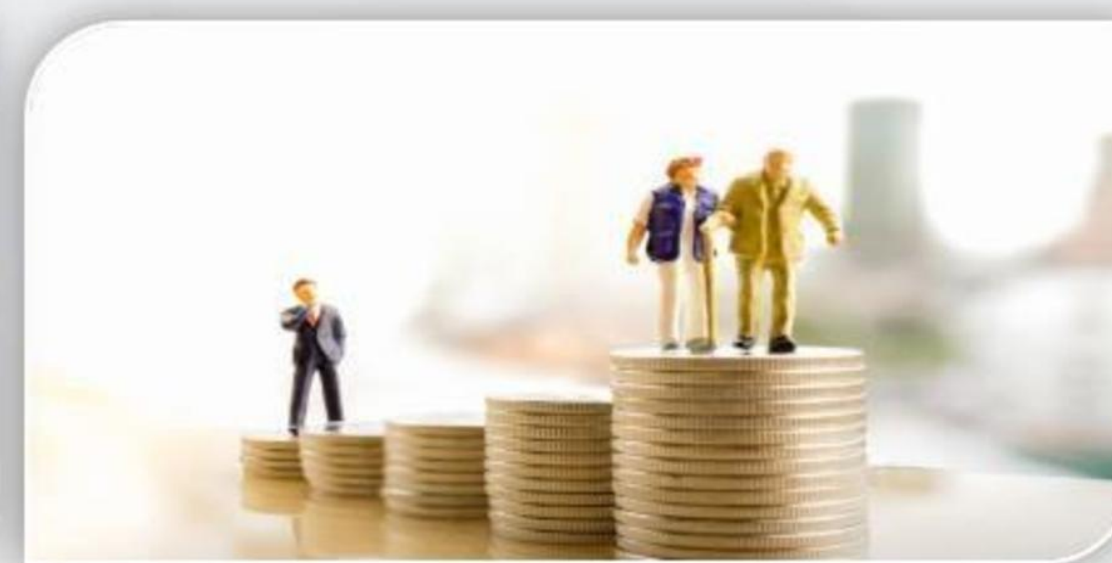
खुशहाल वृद्धा अवस्था