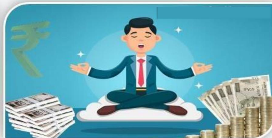
मन चाहा पैसा