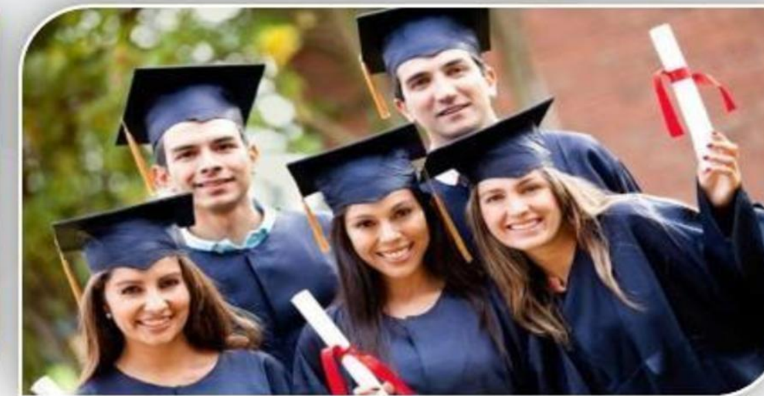
बच्चों की शिक्षा