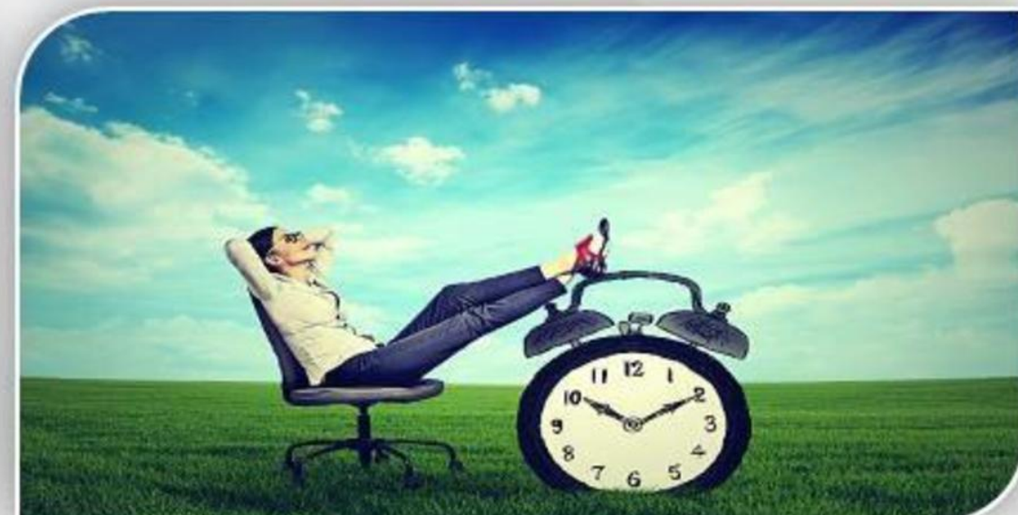
समय की आजादी