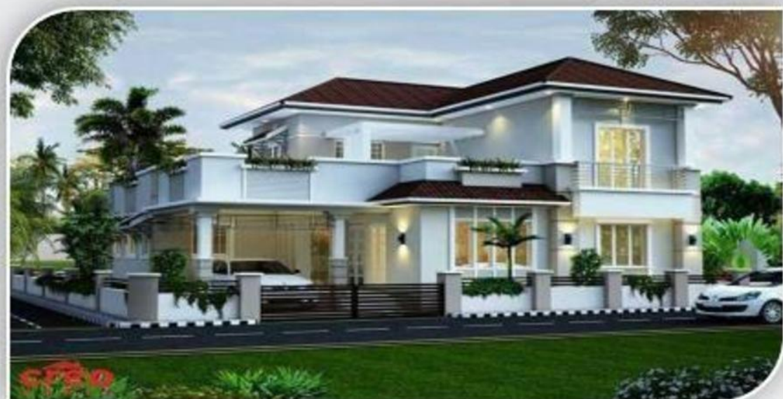
सपनो का घर