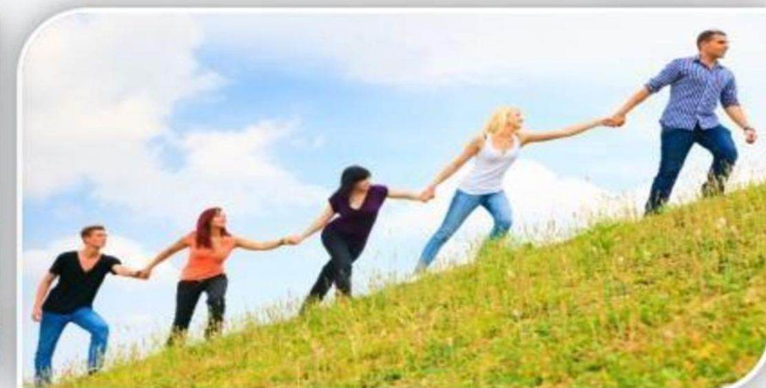
लोगों की मदद